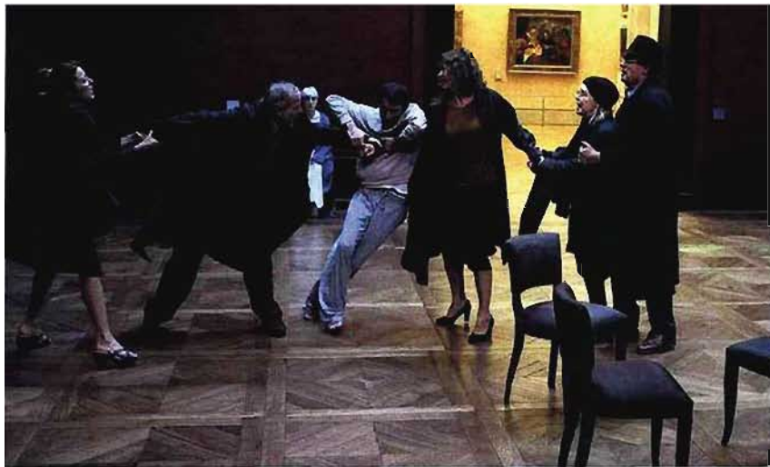
« Rêve d'automne », de Jon Fosse, dans le salon Denon du Louvre.

Tous ces morts, on les voit sur les parquets du Louvre. Patrice Chéreau convoque même les deux dont il est question dans la pièce, sans qu'ils en soient des personnages : Gaute, et la grand-mère. C'est