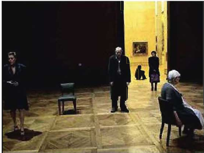
Sept comédiens d'exception orchestrent un grand bal funèbre et feutré...

Une pièce qui se tient tout du long dans un cimetière - un seul espace, où le temps capricieux se délite, avance et recule sans crier gare. Ce n'est pas sinistre, un cimetière. C'est juste triste et doux... Un lieu de visite, de promenade et de recueillement, où la vie, les souvenirs, l'histoire et la beauté des jours défilent solennels - comme dans un musée.