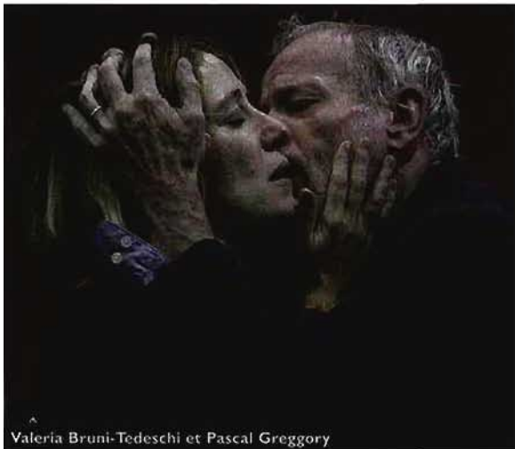
Valeria Bruni-Tedeschi et Pascal Greggory

famille qui se déchire et se décime peu à peu. Les premières représentations de « Rêve d'automne » ont eu lieu dans le salon Denon du Musée du Louvre, dont Patrice Chéreau est le grand invité. C'est maintenant au Théâtre de la Ville que ce spectacle va rencontrer son public, dans un nouveau cadre. Comment Richard Peduzzi, le scénographe de Chéreau, recréera-t-il l'atmosphère du Louvre ? On l'ignore. Mais Chéreau savait ce qu'il faisait en